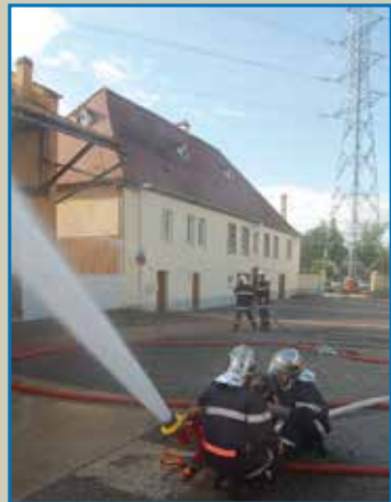
Des pompiers internes à l'entraînement

Ce dispositif alerte la population environnante tout en organisant les secours et en réglementant la circulation autour du site.